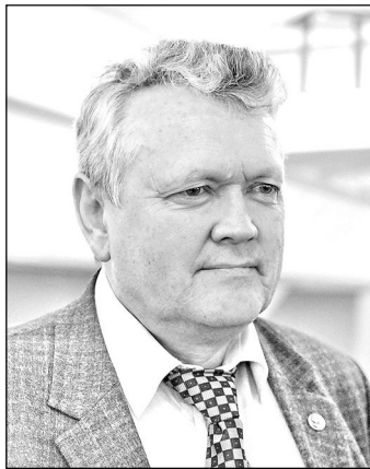
А.Л. Асеев председатель Сибирского отделения Российской академии наук