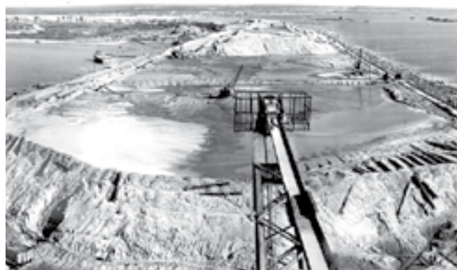
Намыв плотины Новосибирской ГЭС. 1950–1960-е гг.

Новосибирскую ГЭС возводили почти десять лет (если считать от образования специализированного монтажного управления «НовосибирскГЭСстрой» и до сдачи последнего крупного объекта — моста). Кроме того, «НовосибирскГЭСстрой» занимался также и строительством Академгородка. (Правда, в конце августа 1957 года управление не совсем справилось с поставленной задачей. Учтя, что необходимо было монтировать агрегаты ГЭС, не хватало людей и ресурсов. В связи с этим уполномоченный Оргкомитета СО АН СССР С.Х. Дадаян даже отправил секретарю ЦК КПСС Л.И. Брежневу соответствующую телеграмму, где упирал на срыв решения о создании Сибирского отделения и просил дополнительные рабочие руки.)