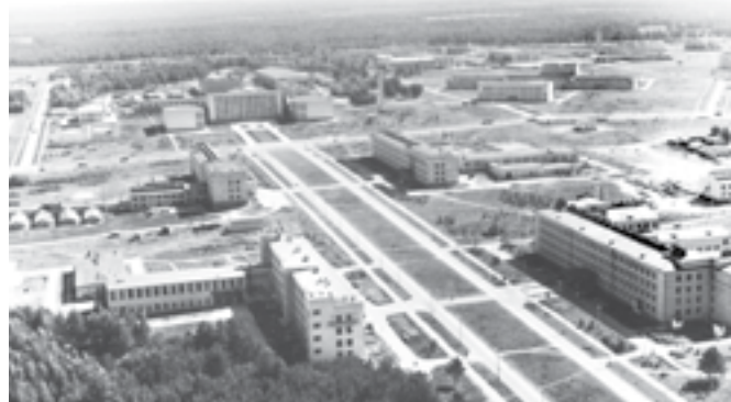
Университетский проспект (ныне проспект Академика Колтыга). Видны Институт ядерной физики (прямо), Институт цитологии и генетики и Институт математики (слева), Институт автоматики и Институт геологии (справа). 1966 г.

Очевидно, что он был одним из «локомотивов» создаваемого района. Тот самый научный центр в Сибири, о котором так много говорили, и проект которого так усиленно продвигали три академика: Михаил Лаврентьев, Сергей Христианович и Сергей Соболев.