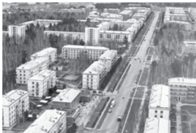
Центральная улица новосибирского Академгородка — Морской проспект. 1970 г.

Советский район Новосибирска начался с двух великих строек: ГЭС и научного центра, которые разворачивались в 1950-е годы. Глобальными проектами руководили из города, что было весьма неудобно. Чтобы оперативно решать возникающие проблемы (развитие инфраструктуры, вопросы строительства, доставка материалов), необходимо было иметь административные структуры, принимающие решения, в одном месте.