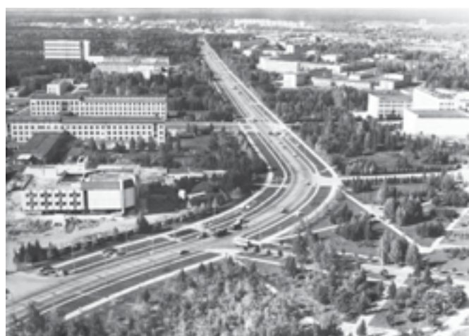
Проспект Академика Лаврентьева. Вид сверху. 1980 г.

Очевидно, что он был одним из «локомотивов» создаваемого района. Тот самый научный центр в Сибири, о котором так много говорили, и проект которого так усиленно продвигали три академика: Михаил Лаврентьев, Сергей Христианович и Сергей Соболев.