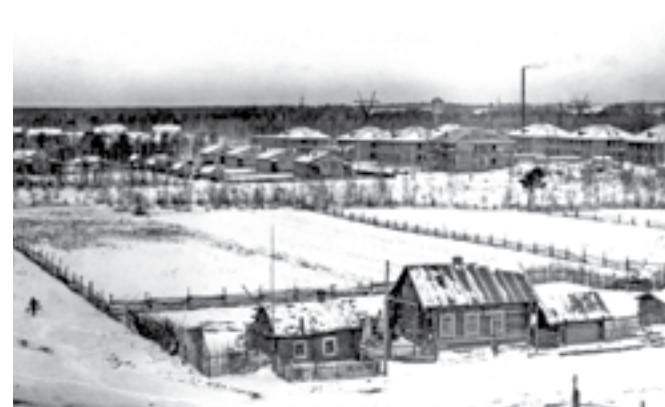
Первым строился микрорайон «Щ» — это были щитовые деревянные бараки для строителей (отсюда и название — «Щ») неподалеку от железнодорожной станции Сеятель и небольшой деревни Чербузы. На снимке: дома старой деревни и строящегося поселка строителей. 1959 г.