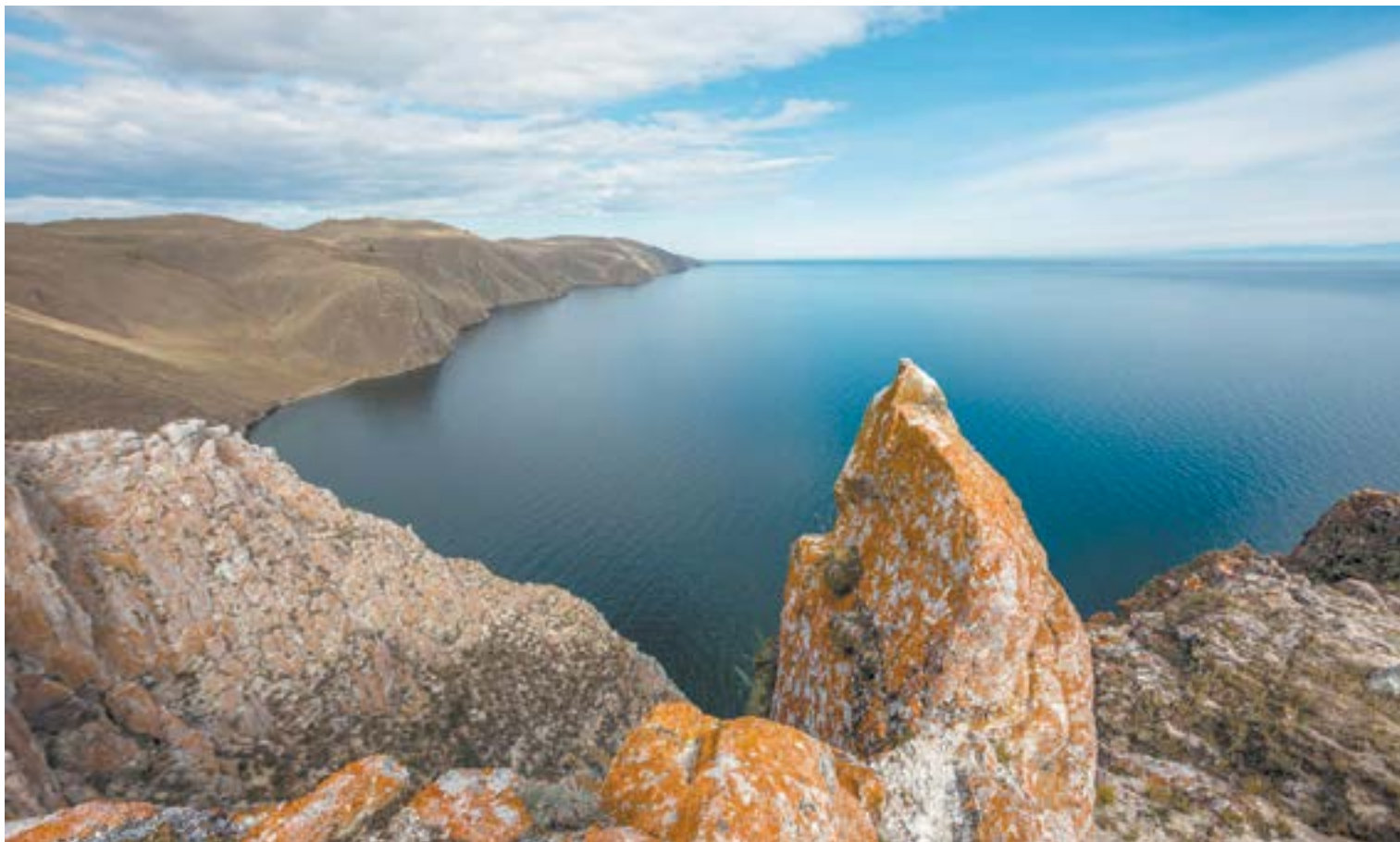
Жемчужина России — Байкал

В настоящее время отходы с Ольхона вывозятся на паромах, источников пресной воды на острове практически нет (ее добывают из нескольких скважин и продают населению). Присутствуют проблемы и с отоплением. На сегодняшний день наиболее дешевый способ обогрева домов там — электричество. Дело в том, что 98 % территории Ольхона — это национальный парк, в котором без разрешения даже грибы собирать нельзя. Получается, единственный приемлемый путь развития для острова — новые энергоэффективные экологические технологии.