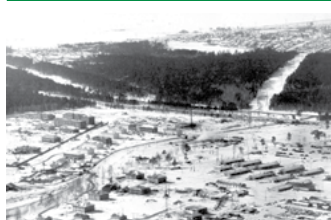
Микрорайон «Щ» в начале строительства. 1961 г.