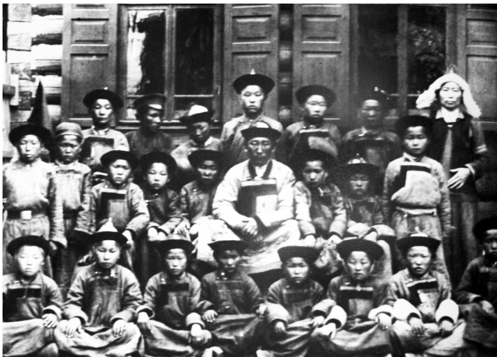
Рис. 12. Этническая политика государства на первом этапе (20—90-е гг. XIX в.) по отношению к коренному этносу (бурятам) отличалась признанием необходимости сохранения традиционного уклада жизни коренного народа. Угданская школа Агинского ведомства, 1915 г.

тодах полицейского контроля и принудительной колонизации. Второй период — конец XIX—начало XX вв. — характеризуется преобладанием русификаторских тенденций в политике, унификацией форм управления народами. Советский период характеризовался политикой создания единой советской общности, но, в конечном итоге, усилия были направлены на достижение геополитических интересов государства: трансляцию политических идей во Внутреннюю Азию через усиление экономического и культурного влияния в регионе. Период, начавшийся в конце 1980-х гг., в Бурятии, как и в других национальных регионах России, характеризовался бурным процессом национально-культурного возрождения, утверждения этнической идентичности. Этот период отличается значительными противоречиями