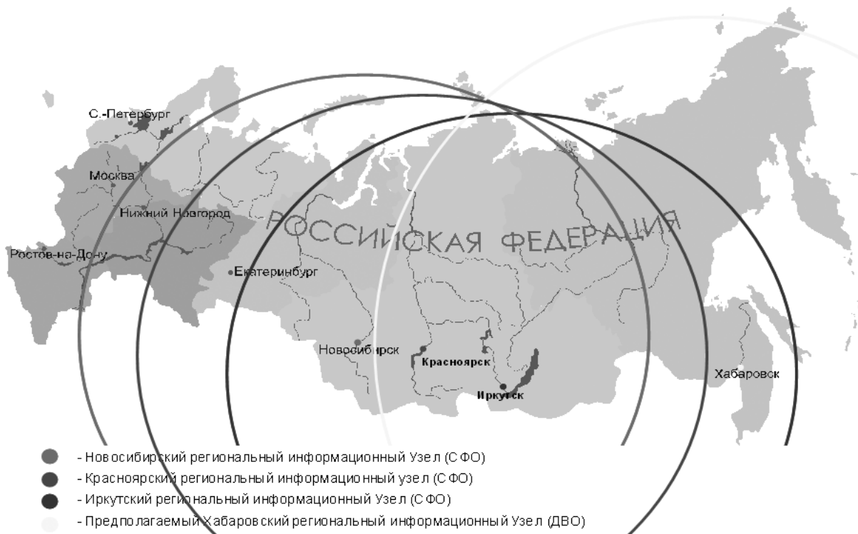
Рис. 3. Зона покрытия территории СФО станциями приема ДДЗ, расположенными в Новосибирске, Красноярске, Иркутске. Возможно создание соответствующего информационного узла в Хабаровске, который позволит закрыть всю территорию Сибири и Дальнего Востока